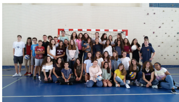
Equipas de Voleibol Iniciados

Os atletas do Agrupamento estiveram, mais uma vez, em alta. Os nossos alunos alcançaram resultados espetaculares nas várias modalidades dos Grupos Equipa e nos Projetos Especiais em que o Agrupamento participa.