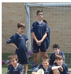
Equipa de Infantis de Tag Rugby

Na Taça CNID , o Agrupamento participou nas modalidades de Ténis de Mesa, Atletismo, Basquetebol 3x3 e Andebol. A classificação resultante do somatório dos pontos obtidos por todas as equipas, deu-nos um brilhante 2º lugar