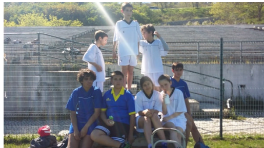
Equipas de Rugby Infantis B, Iniciados e Juvenis