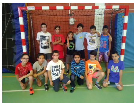
Equipa de Andebol Infantis B