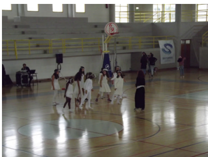
Equipa de Atividades Rítmicas e Expressivas