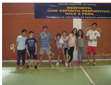
Equipa de Badminton