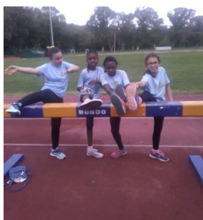
Equipa de Atletismo