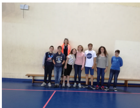
Equipa de Canoagem